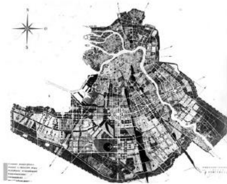
Приложение 5. Утверждённый проект планировки Ленинграда. Авторы Л.А. Ильин и др. 1935 год. Цит.: Архитектура и строительство, №4, стр. 62-71.