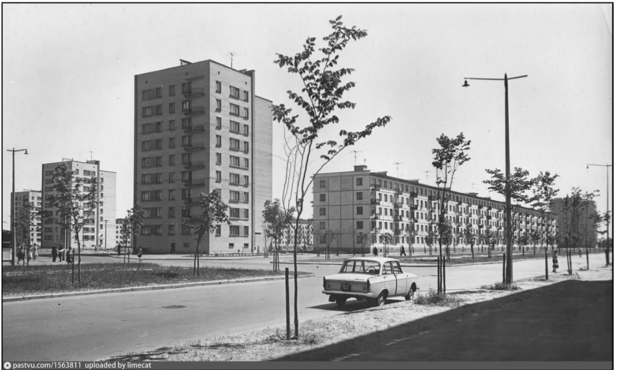
Приложение 15. Проспект Шаумяна. 1967 год.