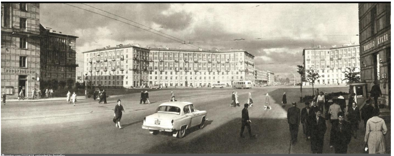
Приложение 14. Заневская площадь. 1968 год.