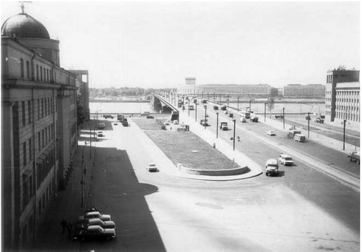
Приложение 13. Съезд с моста Александра Невского. 1965 год.