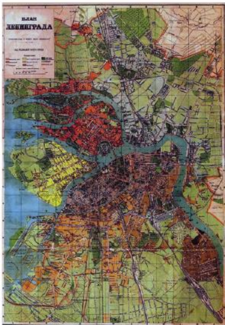
Приложение 2. Городской план Ленинграда. 1922–1925 годы. Цит.: Архитектура и строительство, №4, стр. 62-71.