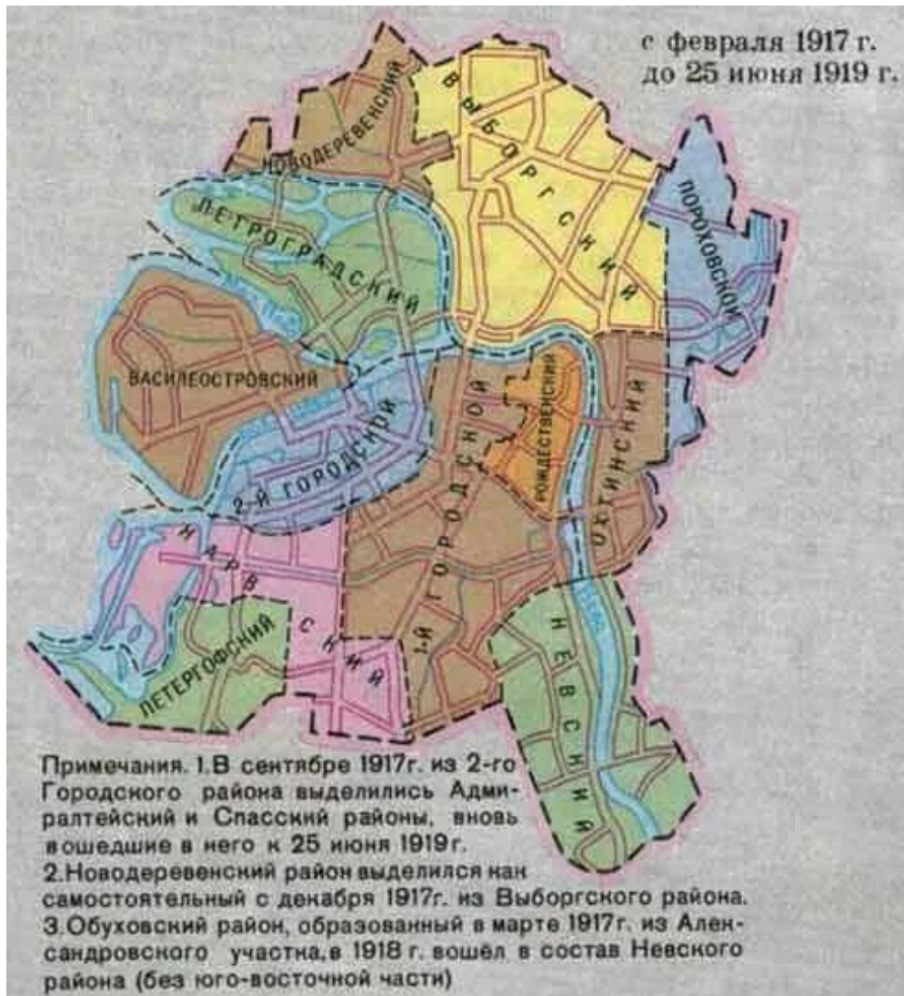
Приложение 1. Административно-территориальное деление города 1919 года.