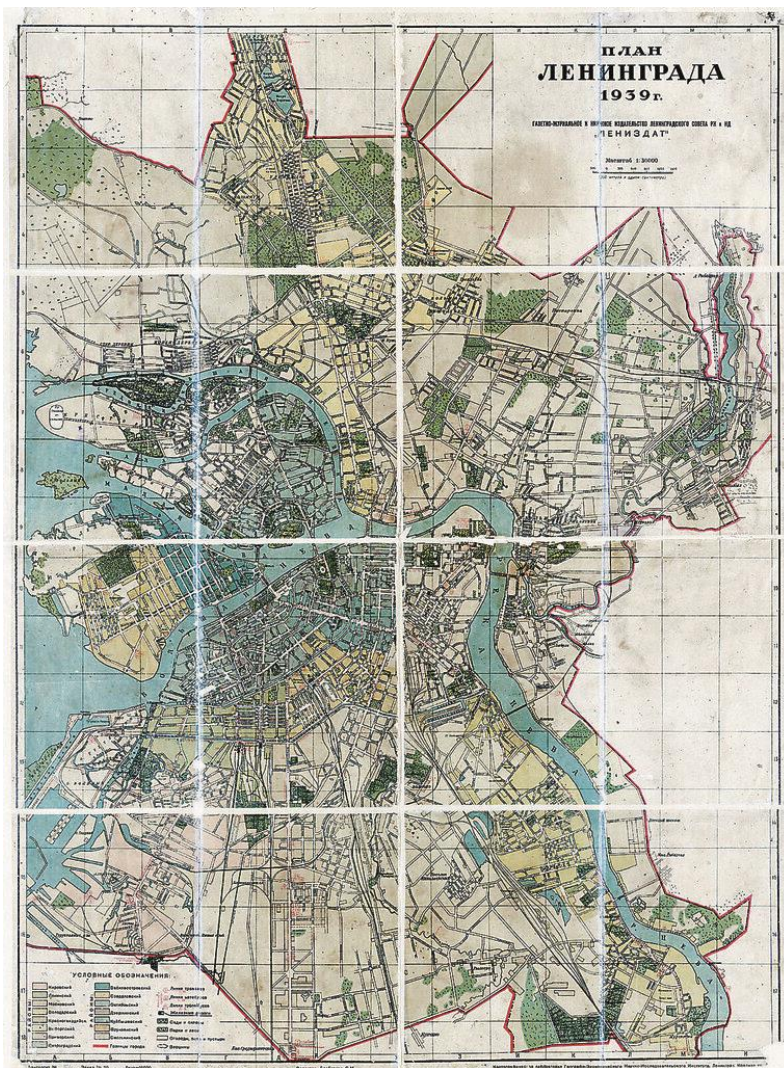
Приложение 6. Первый генеральный план города. Баранова Н. В., Наумова А. И. 1939 год.