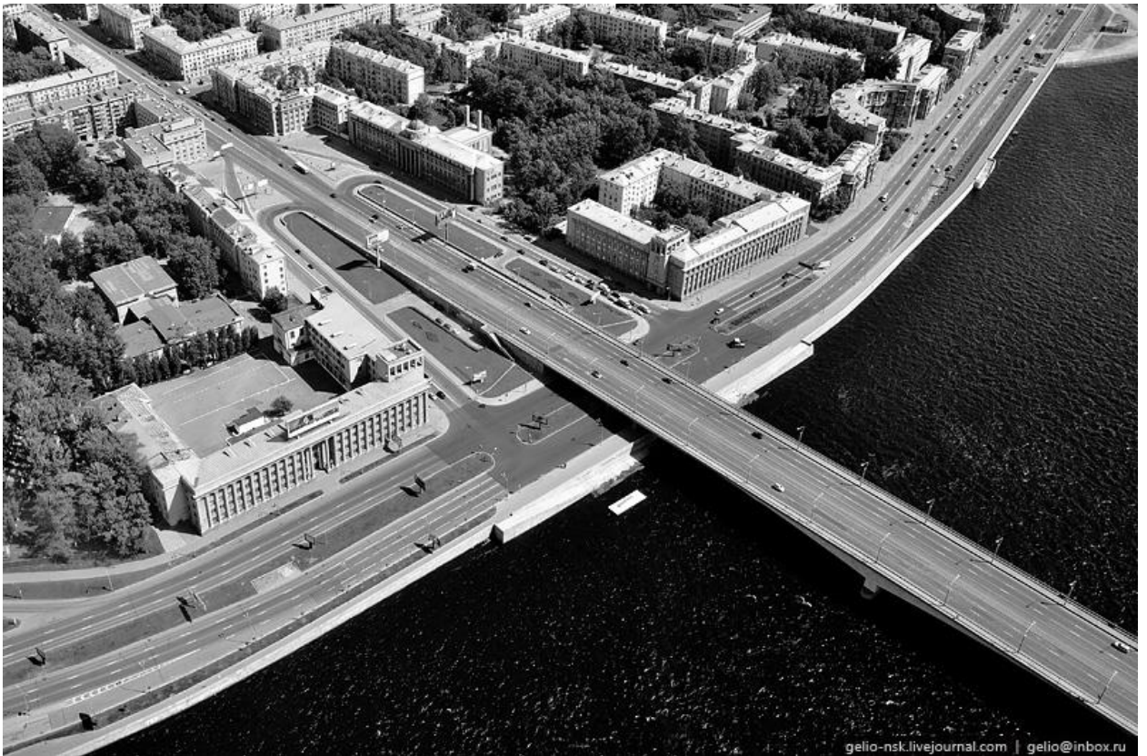
Приложение 12. Вид на мост Александра Невского и Заневский проспект.