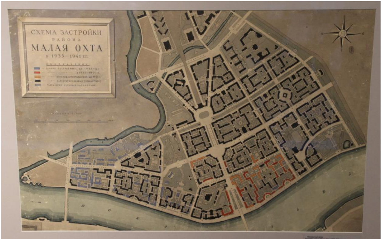
Приложение 9. Схема застройки района Малая Охта в 1935-1941 гг.