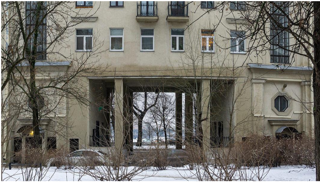
Приложение 11. Малоохтинский проспект, 94.